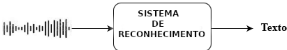
Figura 2.2: Conversão do áudio da fala em sua transcrição textual.

Essa tarefa tem diversas aplicações, mas a mais difundida é no uso de assistentes de voz, também conhecidos como assistentes virtuais. Os assistentes, comumente embutidos em